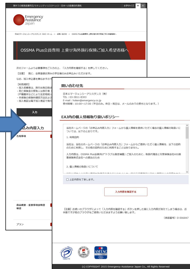
申込画面に遷移するので、情報を入力し、申込み