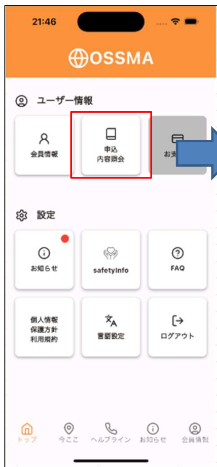
アプリの「申込内容照会」