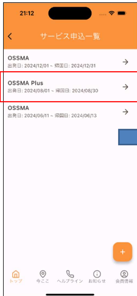
該当のOSSMA Plusの渡航内容を選択